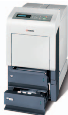
Abb. mit Optionen