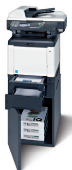
Foto toont product incl. opties

KYOCERA Document Solutions Nederland B.V., Beechavenue 25, 1119 RA Schiphol-Rijk, Tel +31 (0) 20 58 77 200, Fax +31 (0) 20 58 77 290, www.kyoceradocumentsolutions.nl, informatie@dnl.kyocera.com