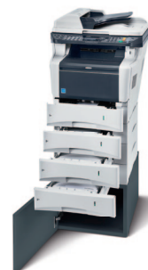
Foto toont product incl. opties.