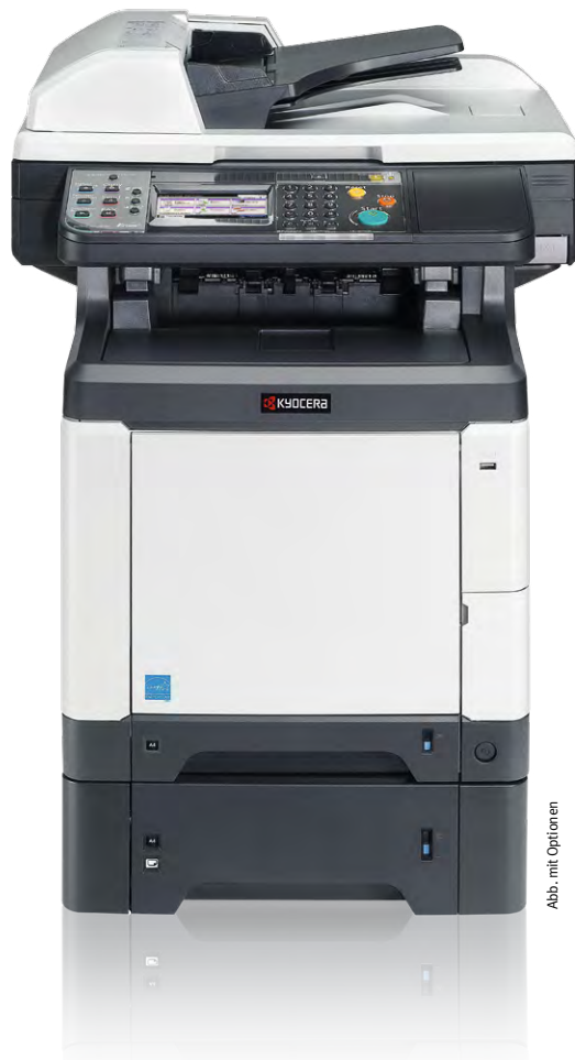
Abb. mit Optionen