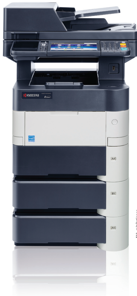
Abb. mit Optionen