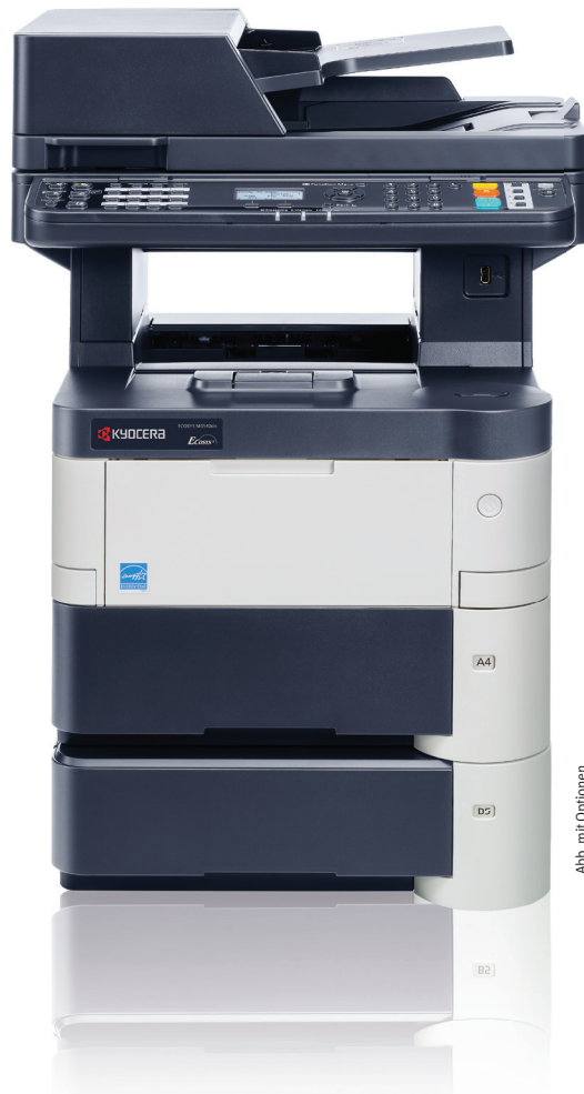
Abb. mit Optionen