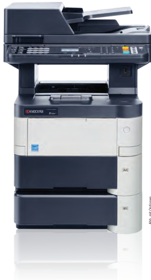
Abb. mit Optionen