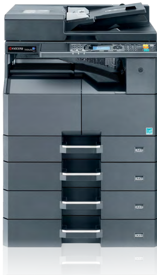
Abb. mit Optionen